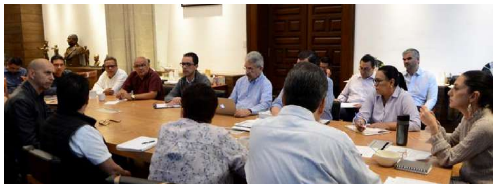
Nuestro Consejero Presidente participa de manera activa en el Gabinete de Seguridad y Justicia del Gobierno de la Ciudad de México.